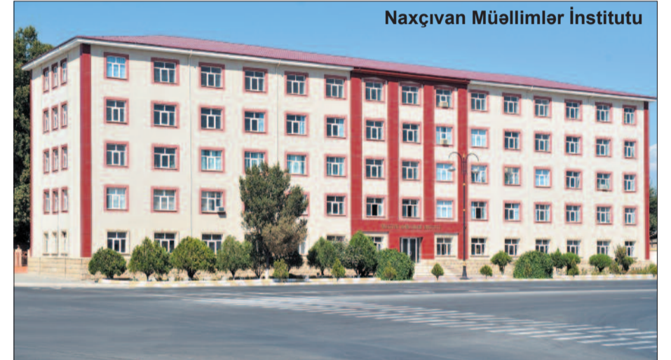
Naxçıvan Müəllimlər İnstitutu

çevrilməsi və müstəqil fəaliyyətə başlaması bu mənada çox əhəmiyyətli yətlidir. Muxtar respublikamızda təhsilə göstərilən diqqət Naxçıvan Müəllimlər İnstitutunun da fəaliyyətinə geniş imkanlar açmışdır. Ötən dövrdə institutun binası yenidən qurularaq lazımi tədris şəraiti yaradılmış, maddi-texniki baza gücləndirilmişdir. Ali təhsil müəssisəsində bu imkanlardan yararlanaraq ixtisaslı kadrların hazırlanması sahəsində mühüm nailiyyətlər əldə edilmişdir. 15 il bundan öncə 21