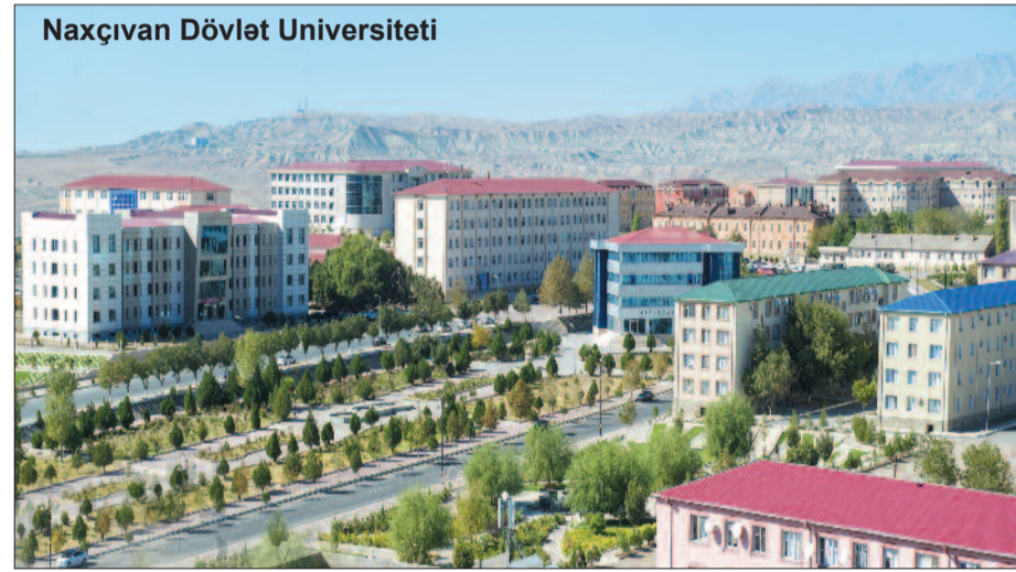
Naxçıvan Dövlət Universiteti

Bu amil əsas tutularaq muxtar respublikada ali təhsil ocaqlarının infrastrukturunu daha mükəmməl şəkildə qurulur, təhsilin səviyyəsi daim yüksəldilir